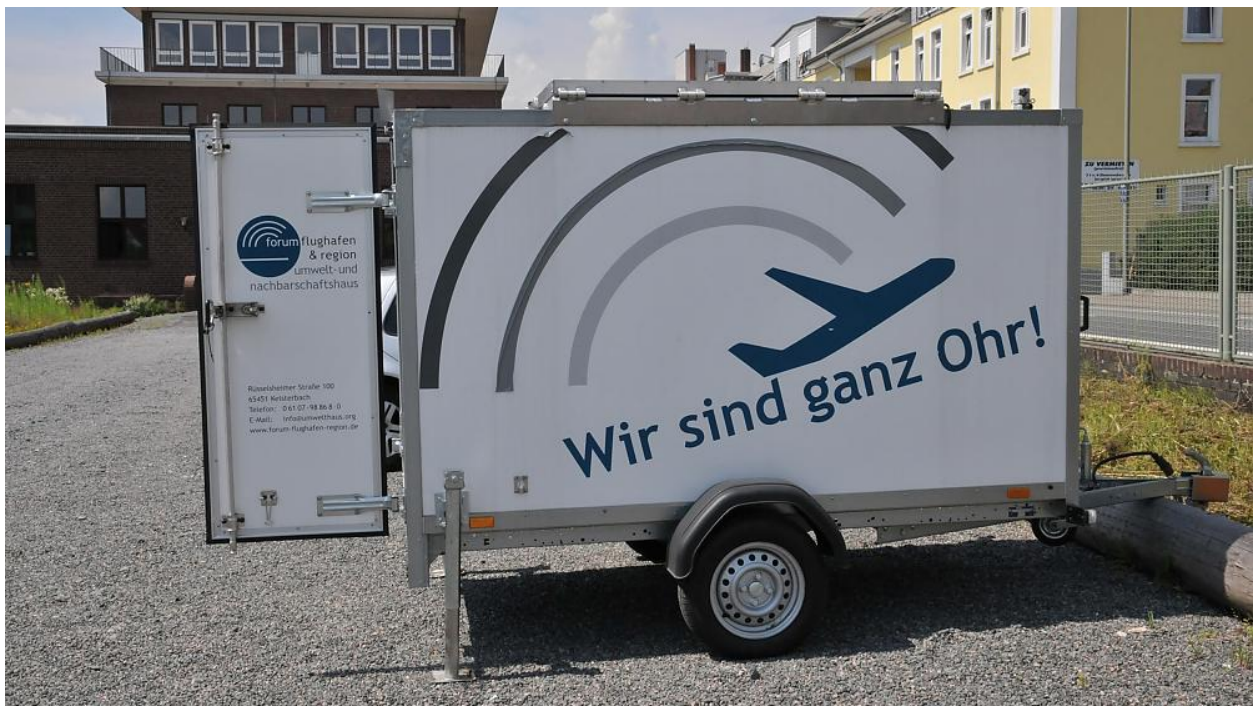
Eine der zwei mobilen Messstationen des UNH – ein mit Messequipment ausgestatteter Autoanhänger.

Wollen Sie Standort für die mobile Messstation werden? Dann nehmen Sie Kontakt ( https://www.umwelthaus.org/ueber-uns/kontakt/ ) mit uns auf.