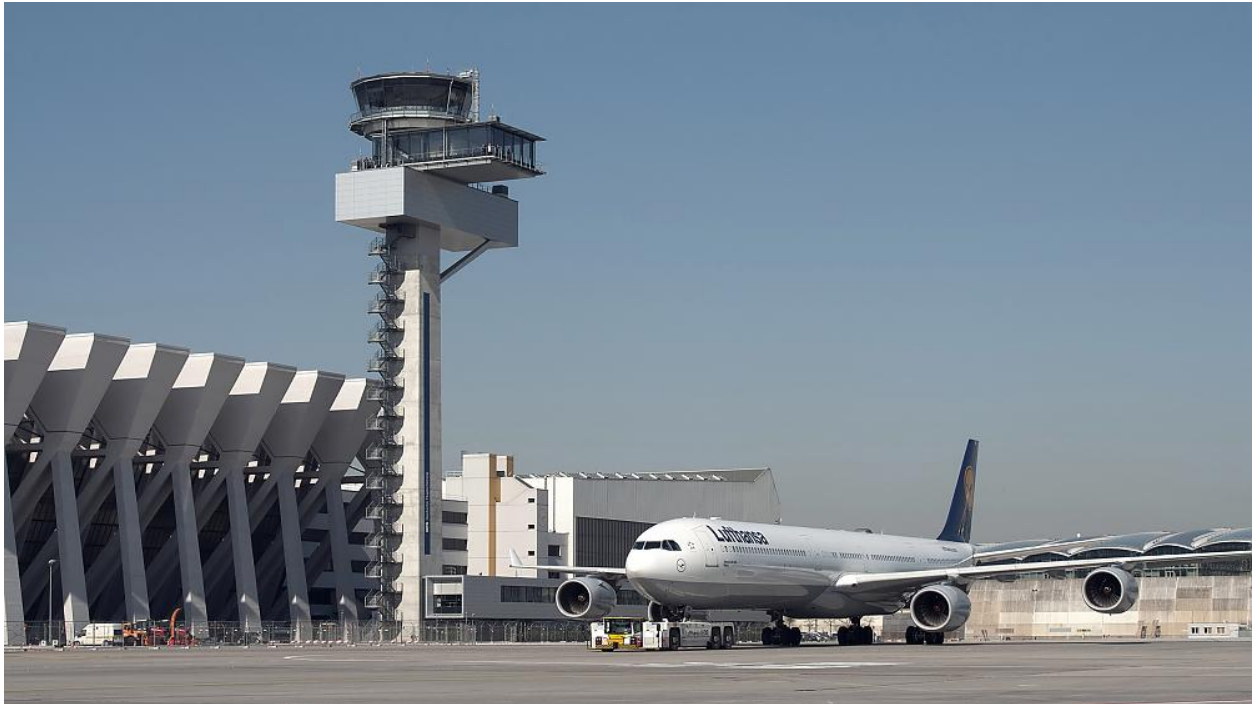
Tower Frankfurter Flughafen - über die Betriebsrichtung entscheiden die Lotsen der Deutschen Flugsicherung