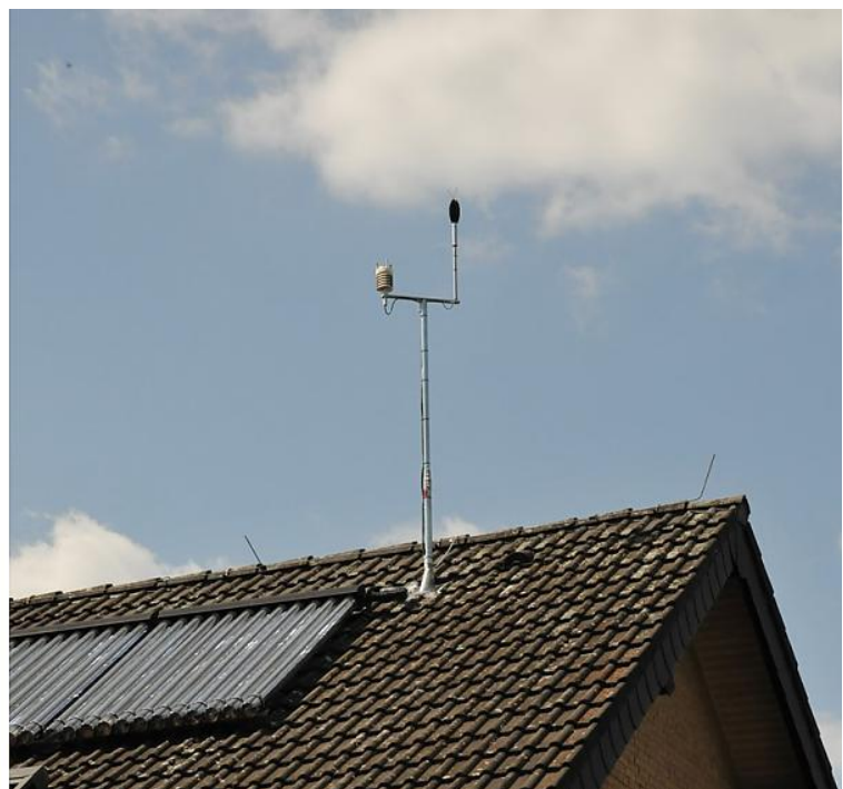
Zwei mobile und neun fest installierte Messstationen erfassen den Fluglärm