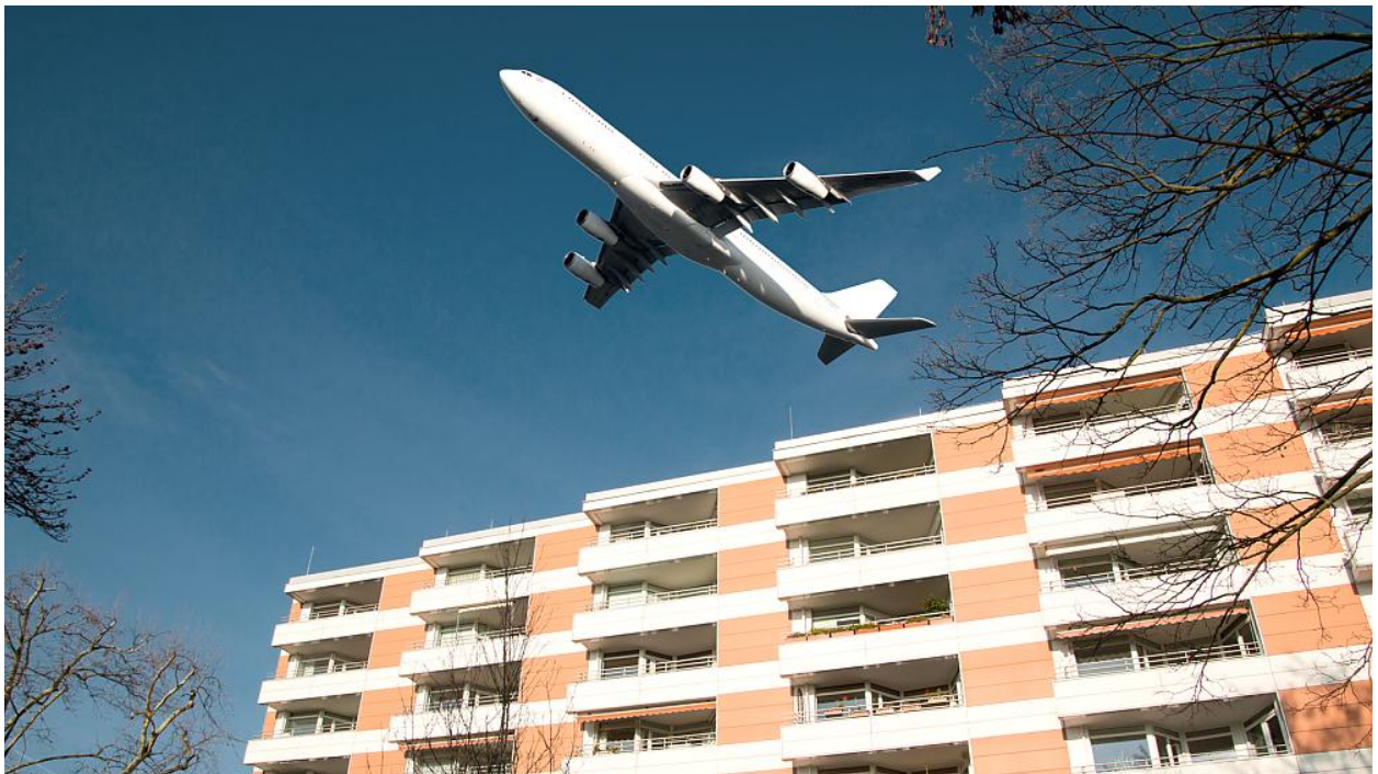
Passiver Schallschutz – Lärmentlastung am Einwirkungsort

Passiver Schallschutz zielt darauf ab, den Lärm am Einwirkungsort zu reduzieren. Dabei handelt es sich in der Regel um bauliche Schallschutzmaßnahmen die dafür sorgen, dass weniger Lärm in die Häuser von Anwohnern dringen kann (z.B. Einbau von Schallschutzfenstern oder Dämmung von Wänden und Dächern).