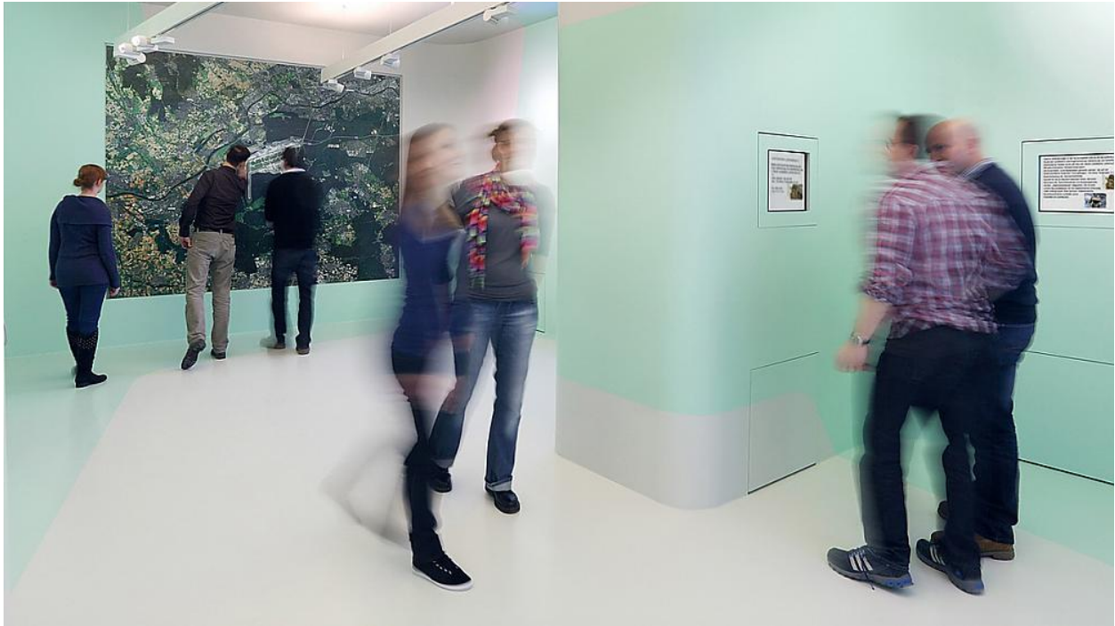
Einen Einblick in das Umweltmonitoring-Programm des UNH gibt der Raum Luftverkehr & Umwelt.