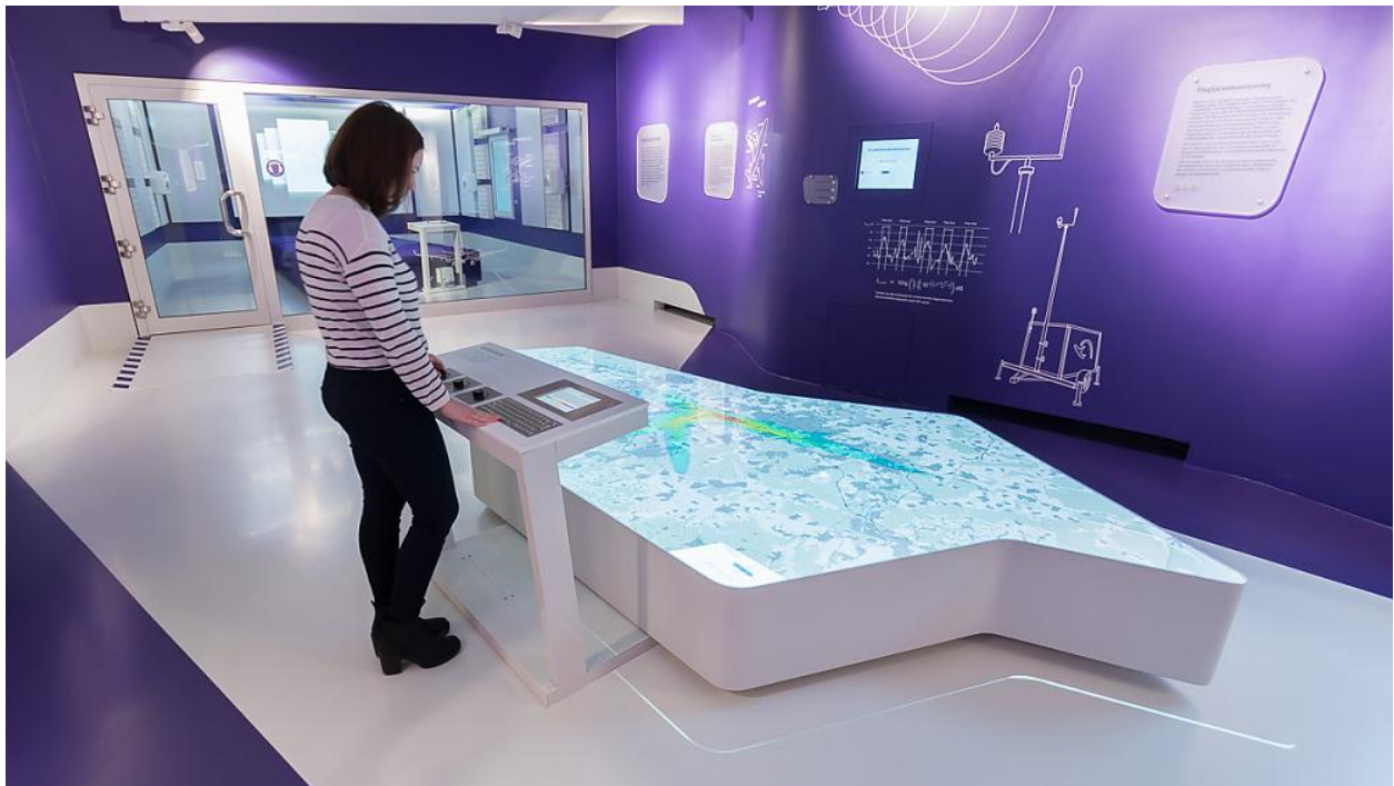
Der Medientisch macht Fluglärm "sichtbar".