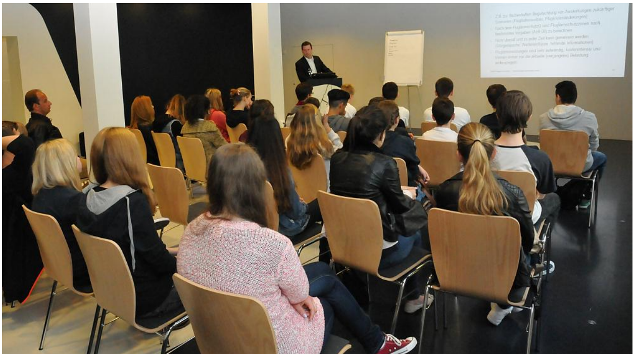
Informationsveranstaltung im UNH.

Mehr Infos zum Dialog-Zentrum ( https://www.umwelthaus.org/ueber-uns/aufgaben/hintergrundinfos-zum-dialog-zentrum/ )