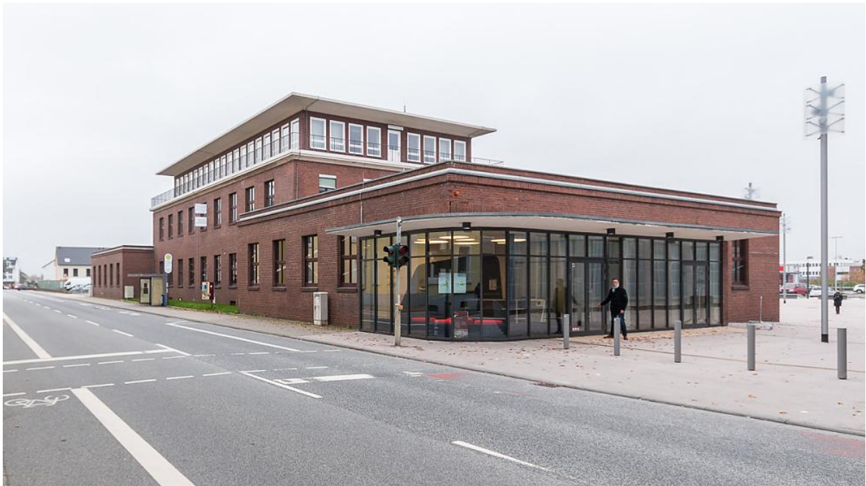
Das Umwelt- und Nachbarschaftshaus in Kelsterbach.

Das Umwelt- und Nachbarschaftshaus (UNH) ist eine Einrichtung des Landes Hessen. Es ist aus dem Regionalen Dialogforum Flughafen Frankfurt hervorgegangen und wird zu 100% durch das Land Hessen finanziert. Das UNH ist Informations-/Dialog- und Monitoring-Zentrum und gemäß Satzung zu Neutralität und Transparenz verpflichtet.